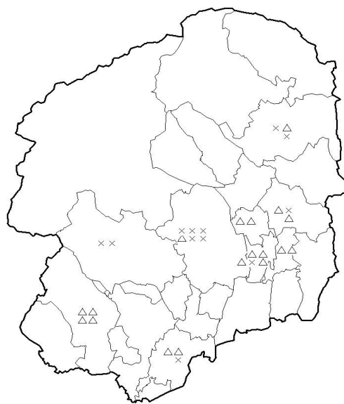
②なし黒星病発生葉率(2010年6月)